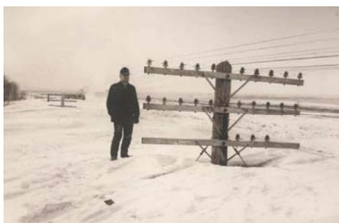
Stort snödjup i Kanada

Slutligen berättar han om vintern 1923-24. Han hade flyttat till en gård i Vireda. Den 23 oktober började det snöa och blåsa kraftigt. Det fortsatte hela natten. Dagen efter var den stora flytt dagen för pigor och drängar. Både pigan och drängen skulle flytta och han skulle skjutsa dem till Hultrums station. Tåget gick redan kl. 7 på morgonen. Han tog fram hästar och spadar för att skotta vid behov. Det visade sig dock att snön hade packats så hårt så det var nästan en isyta ovan. Det gick inte att följa vägarna utan man fick sväng in över åkrar och ängar där snön var mindre djup. Snön gick inte bort efter detta utan bara byggdes på. Längs vägarna var under vintern bitvis drivorna så