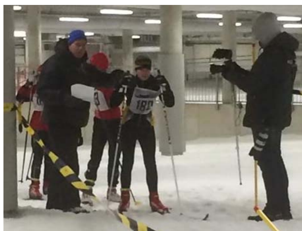
Ski 2016. Två ytterligare tävlingar ingår i cupen och genomförs under januari varav en går i Lövhult.