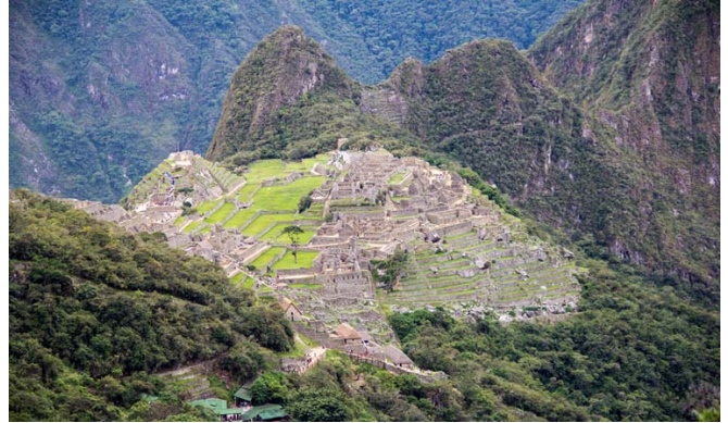
Machu Picchu sett från Solporten

I trakten runt om ser man många imponerande rester av byggnader och terrassering från Inkatiden. Den mest kända är väl Machu Picchu. Dit skulle vi vandra. De tappreste gick den klassiska fyradagars med övernattnings i tält. Vi andra kämpade en dag ca 8 km. Uppför, uppför till vi nådde Solporten med sin utsikt över Machu Picchu. Mycket ståtligt! Alla blev imponerade av inkafolkets förmåga att bygga, både här och vid andra byggnader vi besökte.